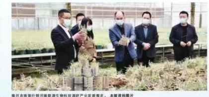
南阳市农信系统工作人员在田间地头为农民提供金融服务，背景为南阳农业科技园。

创新服务新路径 南阳市农信系统共有13家农商行，其中，基础网点4家，农商行9家，机具网点486个，各类自助设备共1.8万台，是全市金融基础设施最完备、网点最多、服务人口最多、覆盖范围最广、辐射力最强的金融工程。 南阳市农信系统充分发挥“红色引擎”在金融中的战斗堡垒作用，助力实体经济高质量发展，为南阳经济社会发展贡献了智慧和力量。