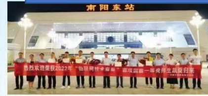
南阳工业职业技术学院师生在南阳东站合影，背景为南阳东站站房。

在产教融合中转型升级 学校主动对接国家重大战略，瞄准河南“十大战略”和南阳“十四五”发展规划，主动融入新发展格局，服务高质量发展，为经济社会发展做出积极贡献。 学校主动对接国家重大战略，瞄准河南“十大战略”和南阳“十四五”发展规划，主动融入新发展格局，服务高质量发展，为经济社会发展做出积极贡献。